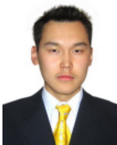
Г.Оч ХЭҮК-ын референт

Сүүлийн 30 гаруй жилийн туршид дэлхийн эдийн засаг даяаршихын хэрээр үндэстэн дамнасан корпорац, бизнесийн байгууллагууд олноор үүсэн бий болж, тэдгээрийн үйл ажиллагааны хамрах цар хүрээ улам өргөжин тэлсэн билээ. Эдгээр бизнесийн байгууллагуудын хүний нөөц нь зарим тохиолдолд жижиг улс орны хүн амтай тэнцэх хэмжээнд хүрсэн нь уг асуудалд олон улсын хамтын нийгэмлэгийн зүгээс анхаарал тавин ажиллах цаг болсныг илтгэж байна. 2007 оны байдлаар дэлхийн нийтийн корпорациудын жилийн ашиг орлого нь дэлхийн дотоодын нийт бүтээгдэхүүний 11 хувийг эзэлсэн нь уг байгууллагуудад их хэмжээний эрх мэдэл төвлөрч байгааг нотлож байна.